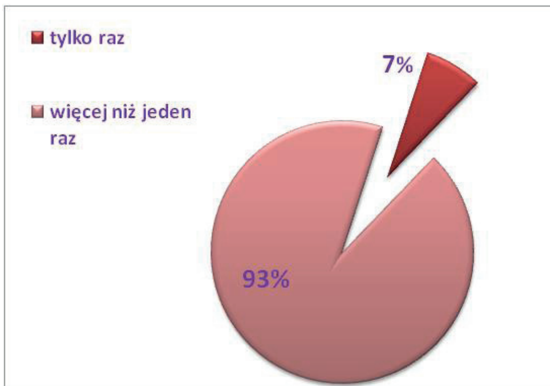
Wykres 4. Ile razy zdarzyło się Pani/Panu podać lek bez zlecenia lekarskiego?